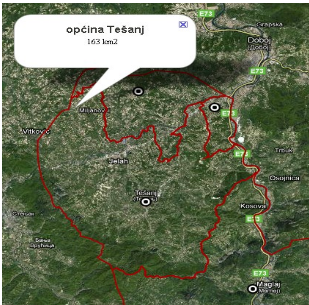
Prikaz općine Tešanj

Općina Tešanj se nalazi na 44° 33' geografske širine na nadmorskoj visini od 230 metara, smještena u sjevernom dijelu BiH, Federacije BiH i Zeničko-dobojskog kantona, jednako udaljena od Tuzle i Zenice, kao najbližih većih centara i graniči sa općinama Teslić, Doboј, Doboј jug, Usora i Maglaj.